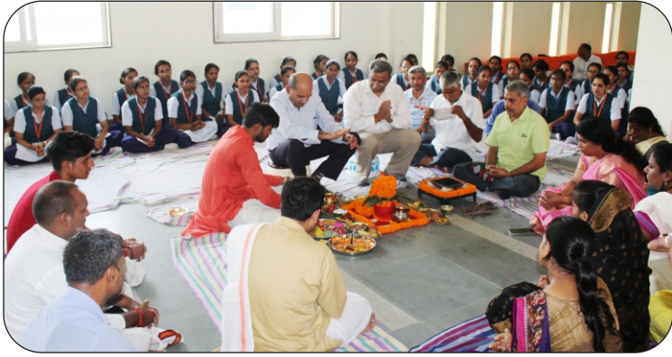
सिमलेशन लैब हेतु पूजा में माननीय कुलपति व अन्य।