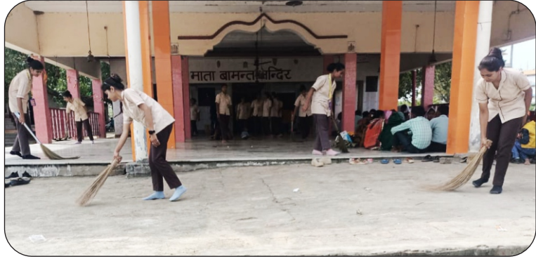
गोरखानाथ कृषि विज्ञान केंद्र व महेसरा पुल स्थिति मंदिर में सफाई करते विद्यार्थी।