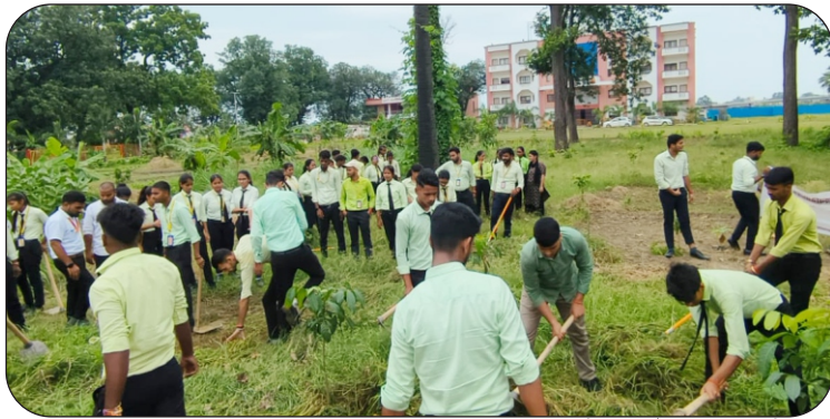
शिक्षक दिवस पर परिसर की साफ-सफाई करते विद्यार्थी।

दिनांक: 05 सितम्बर, 2023 को महायोगी गोरखानाथ