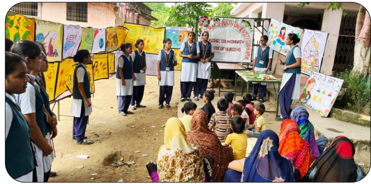
स्वास्थ्य शिक्षा के अंतर्गत ग्राम खत्रीपुरा में ग्रामीणों को जागरूक करती छात्राएं।