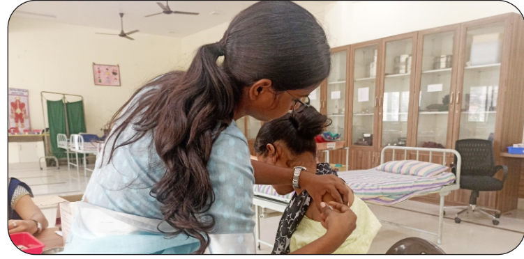
हेपेटाइटिस बी का टीकाकरण करती हुई शिक्षिका।