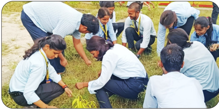
विश्वविद्यालय परिसर में साफ-सफाई करते विद्यार्थी।

दिनांक: 25 सितम्बर, 2023 को विश्वविद्यालय में राष्ट्रीय सेवा योजना के तत्वावधान में भारत