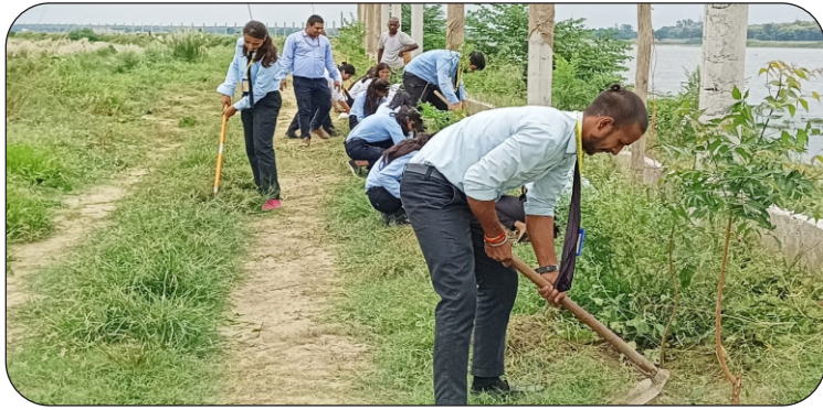
चिलुआताल बांध के किनारे सफाई करते विश्वविद्यालय के विद्यार्थी।

दिनांक: 23 सितम्बर, 2023 को महायोगी गोरखानाथ विश्वविद्यालय में राष्ट्रीय सेवा योजना के तत्वावधान में भारत सरकार द्वारा संचालित दिनांक 15 सितंबर से 02 अक्टूबर के कार्यक्रम योजना 'स्वच्छता ही सेवा' के अंतर्गत संबद्ध स्वास्थ्य विज्ञान संकाय की महायोगी