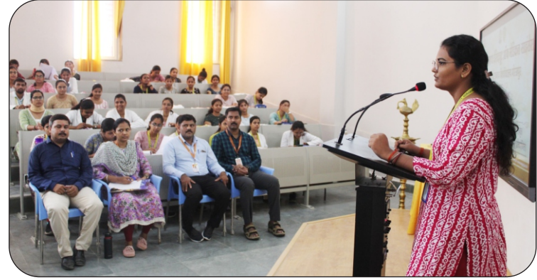
संस्कृत सप्ताह में गीत प्रस्तुत करती बीएएमएस की छात्रा।

वाले कार्यक्रमों से विद्यार्थियों में संस्कृत के प्रति उत्साह दिख रहा है और वे इसे खेल-खेल में गीत, संगीत, संहिता परायण, संस्कृत सम्भाषण और संस्कृत नाट्य मंचनों के द्वारा संस्कृत भाषा को जान रहे हैं।