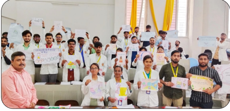
प्रतियोगिता में बनाए गए पोस्टर की प्रस्तुति करते विद्यार्थी।

दिनांक: 01 सितम्बर, 2023 को महायोगी गोरखानाथ विश्वविद्यालय गोरखपुर के