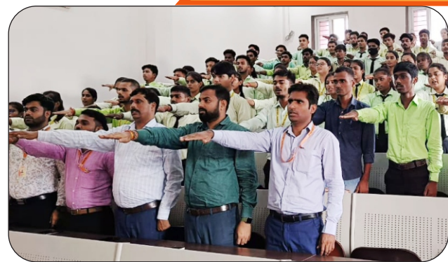
शपथ लेते हुए कृषि संकाय के प्राध्यापक एवं विद्यार्थी।