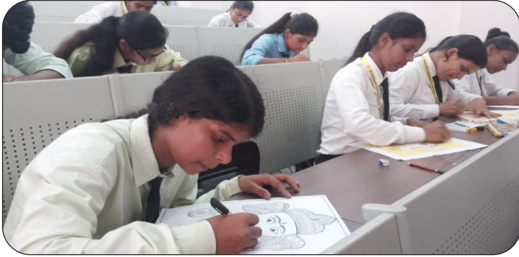
गणेश चतुर्थी प्रदर्शनी प्रतियोगिता में गणेश जी का चित्र बनाती छात्रा।