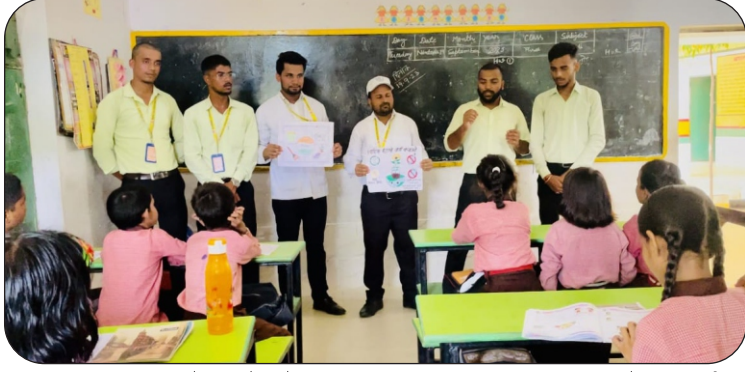
प्राथमिक विद्यालय में बच्चों को प्लास्टिक प्रदूषण पर जागरूक करते विद्यार्थी।

दिनांक: 19 सितम्बर, 2023 को महायोगी गोरखानाथ विश्वविद्यालय, गोरखपुर की राष्ट्रीय सेवा योजना की ईकाई द्वारा आयोजित 'प्लास्टिक प्रतिबंधन पर जागरूकता अभियान' के अंतर्गत महायोगी गोरखानाथ विश्वविद्यालय, गोरखपुर में राष्ट्रीय सेवा योजना (एनएसएस) की महायोगी