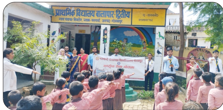
प्राथमिक विद्यालय के बच्चों को पंचप्रण की शपथ दिलाते विश्वविद्यालय के विद्यार्थी।

दिनांक: 21 सितम्बर, 2023 को महायोगी गोरखानाथ विश्वविद्यालय में राष्ट्रीय सेवा योजना के तत्वाधान में भारत सरकार द्वारा संचालित 15 सितंबर से 02 अक्टूबर के कार्यक्रम योजना 'स्वच्छता ही