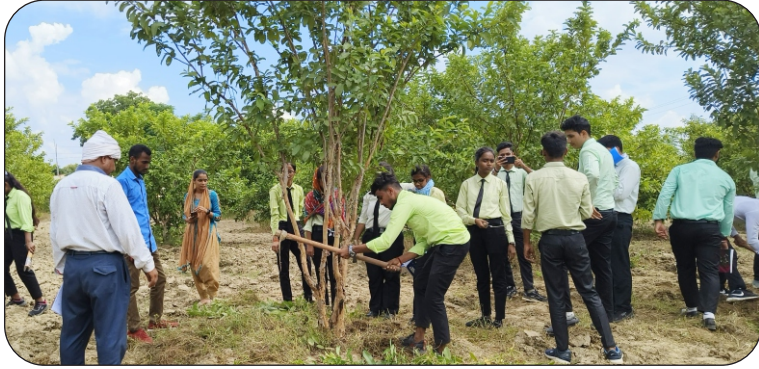
राष्ट्रीय सेवा योजना द्वारा आयोजित 'स्वच्छता ही सेवा' कार्यक्रम के अंतर्गत महायोगी

दिनांक: 20 सितम्बर, 2023 को महायोगी गोरखानाथ विश्वविद्यालय में राष्ट्रीय सेवा योजना के तत्वाधान में भारत सरकार द्वारा संचालित 'स्वच्छता ही सेवा' कार्यक्रम के अंतर्गत महायोगी आदिनाथ इकाई के द्वारा महायोगी गोरखानाथ कृषि विज्ञान केंद्र, पीपीगंज में स्वच्छता अभियान चलाया गया।