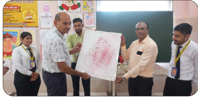
विद्यार्थियों द्वारा बनाए गए चित्रकला का अवलोकन करते माननीय कुलपति।