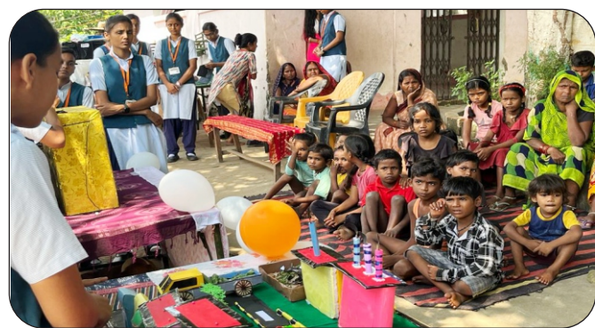
खत्रीपुरा गांव में स्कूल हेल्थ प्रोग्राम विषय पर जागरूकता करती छात्रा।