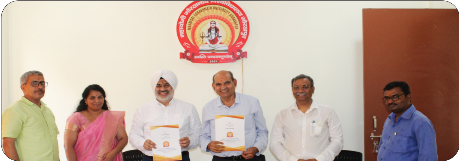
समझौता करार करते हुए विश्वविद्यालय के माननीय कुलपति, कुलसचिव व तीनों कम्पनियों के पदाधिकारीगण।

दिनांक: 02 सितम्बर, 2023 को गुरु गोरक्षनाथ कॉलेज ऑफ नर्सिंग में अध्ययनरत छात्राओं के समयानुकूल नर्सिंग कौशल में अभिवृद्धि करने के उद्देश्य से महायोगी गोरखनाथ विश्वविद्यालय, आरोग्यधाम गोरखपुर ने मेडिकल एजुकेशन के क्षेत्र में कार्यरत तीन प्रतिष्ठित कम्पनियों के साथ शनिवार को संयुक्त रूप से कॉरपोरेट सोशल रिस्पॉसिबिलिटी एमओयू (समझौता करार) किया। इस एमओयू के होने से अब गुरु गोरक्षनाथ कॉलेज ऑफ नर्सिंग में छात्राओं को सिमलेशन लैब (अनुरूपण प्रयोगशाला) के जरिए आर्टिफिशियल इंटेलिजेंस से नर्सिंग प्रशिक्षण की अत्याधुनिक सुविधा मिलेगी।